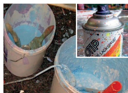
peintures et aérosols ...

!!! Les coûts dus au non-respect de ces dispositions seront facturés aux contrevenants