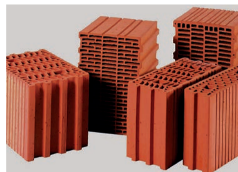
blocs de construction ...