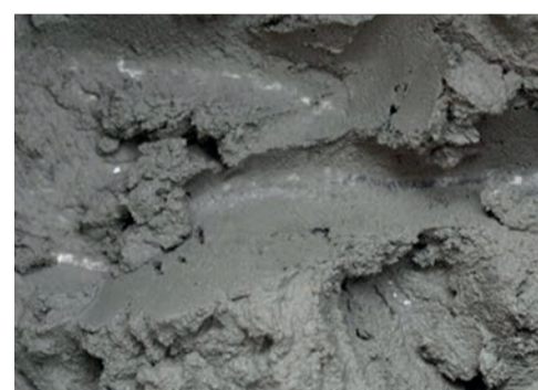
béton et colles liquides ...