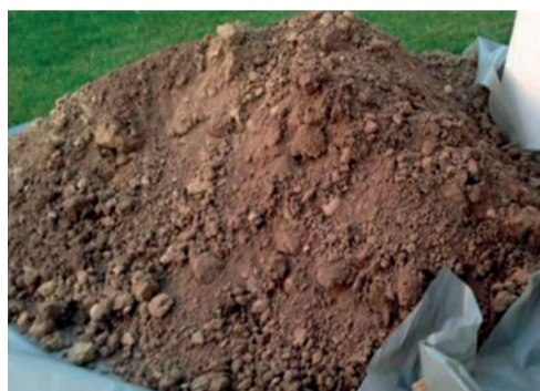
terre de creusage ...