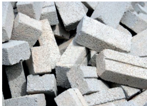
briques ciment, béton ...