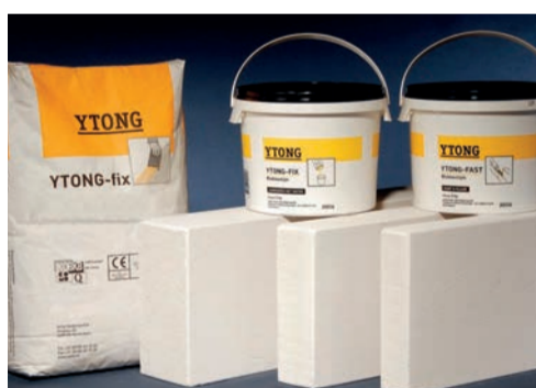
béton cellulaire ...