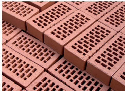
briques en terre cuite ...