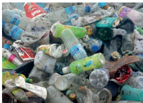
toutes sortes de plastique ...