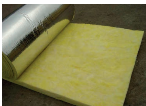
laine de verre ...