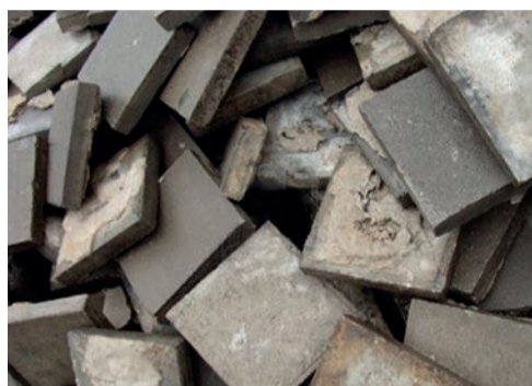
dalles de trottoir ...