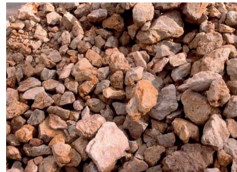
pierres naturelles ...